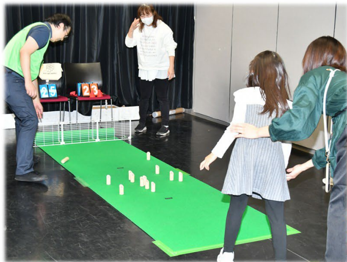
ミニらいとモルック体験