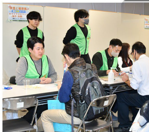
マイクロピペット操作体験