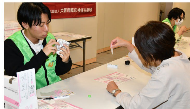
抗原キット操作体験