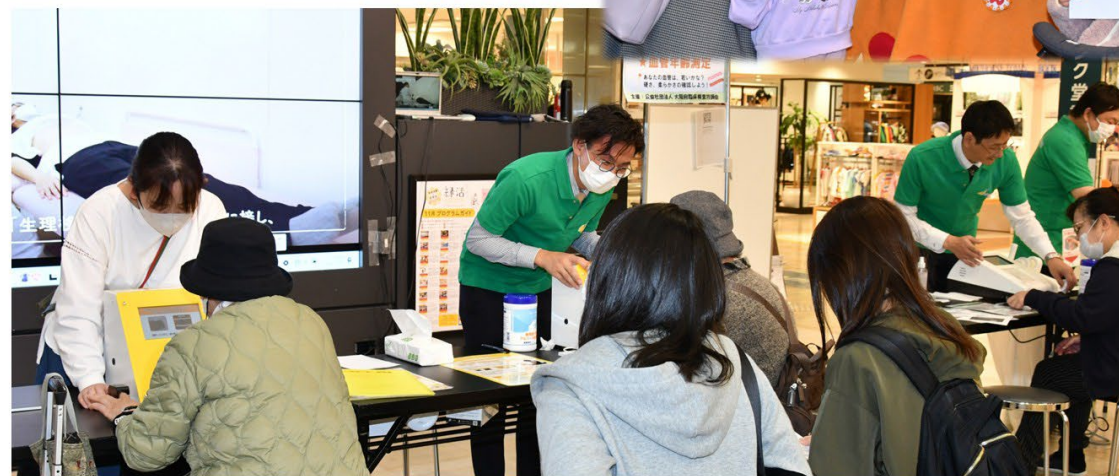
血管年齢&骨密度測定