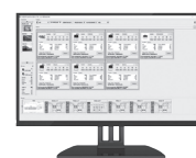
AlinIQ AMS 臨床検査システム