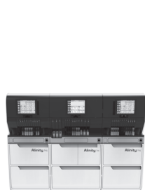
Alinity h-series 全自動総合血液学 分析装置

Alinity・AlinIQは未来に向けたトータルソリューションとして、 変化し続ける医療環境の中で生まれるお客様ごとの課題に対する 解決策を提案します。