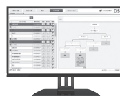
DSS 診断支援システム