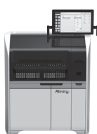
Alinity i 全自動化学発光免疫 測定装置