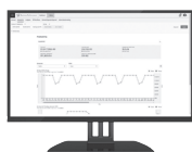
AlinIQ BIS 経営管理システム