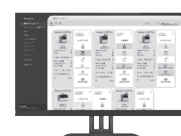
Alinity PRO Alinity 集中管理システム