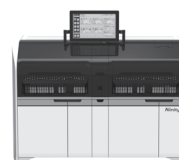
Alinity ci-series 生化学・免疫 インテグレーション装置