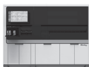
Alinity m 全自動遺伝子 解析装置

アボットのソリューションは検体検査におけるワークフロー の最適化、標準化と自動化による生産性向上、信頼性の高い データ報告を提供します。個々のご施設の多様な課題に対し て柔軟に対応することで、更なる患者中心の医療へのシフト をサポートします。