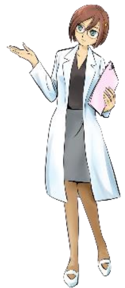
スーパー臨床検査技師 財前カオル

注意点の詳細は、添付の厚生労働省から示されている「薬局で抗原簡易キットを購入する方へ」をご覧ください